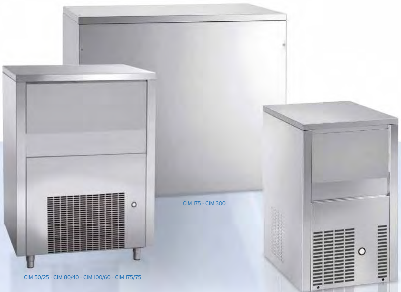
CIM 175 - CIM 300