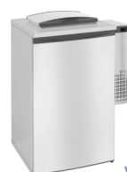
V5-1 | V6-1

V6 | Monoblock Kühlanlage – Die monoblock Kühlanlage kombiniert hohe Leistung und niedrigen Stromverbrauch mit einfachen plug-in Einbau.