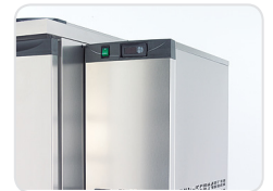
Quick and easy side fitting

V5 | Waste Disposal Coolers – MERCATUS waste disposal coolers are the ideal equipment for commercial kitchens and other bacteriologically sensitive environments.