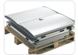
Flat packed modular panels