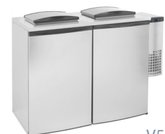
V5-2 | V6-2