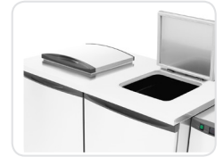
Hygienic waste deposit through sealed lids